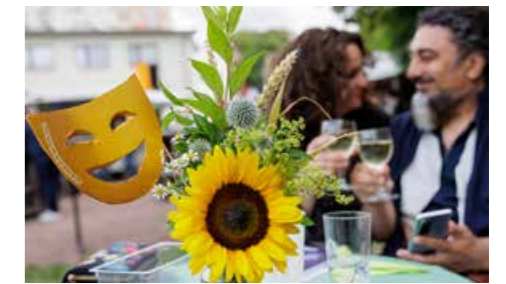
Theatersommerfest, Foto: Jens Schlüter

Verschiedene kleine und große, leise und laute Programmpunkte laden die Gäste ein, das Gelände rund ums Theater zu erkunden und hinter die Kulissen blicken. Feiern Sie mit uns den Saisonabschluss! 6. Juli 2024, 19.00 Uhr im und um das Theater