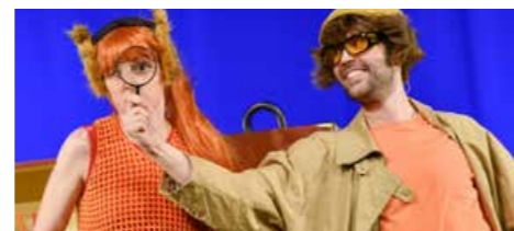
Dachs und Eichhorn, Foto: Markus Scholz

Dachs und Eichhorn – die Meisterschnüffler Di, 6. Februar 2024, 10.00 Uhr Große Bühne